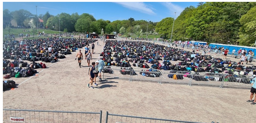
Foto vid 15.00, inlämning på kanterna och klara löpare i mitten på väg ut. Vår rastplats är i bakgrunden, bakom de svarta containrarna.

Väskor från Cityvarvet lämnas på Götaplatsen , öppet 11.00 – 12.30. Här finns 2 personer med körkort. Delas sedan ut vid Preem 13.30 – 15.00. Ej hämtat kommer till oss, placeras efter 50.000.